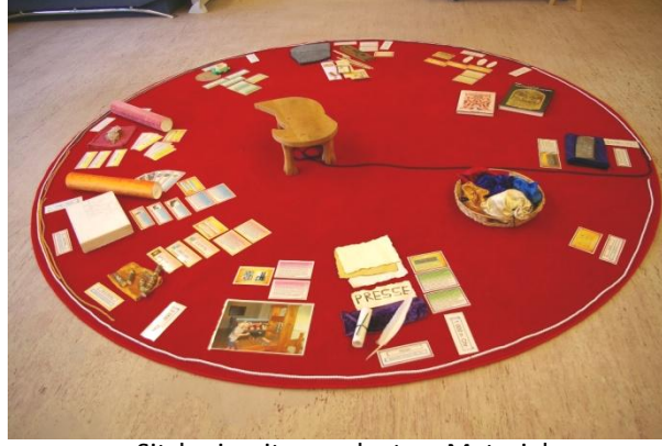
Sitzkreis mit ausgelegtem Material