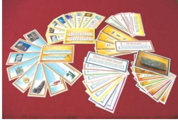
Auszug aus dem Kartenmaterial