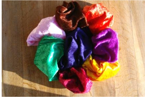
Pannesamtsäckchen zur Aufbewahrung